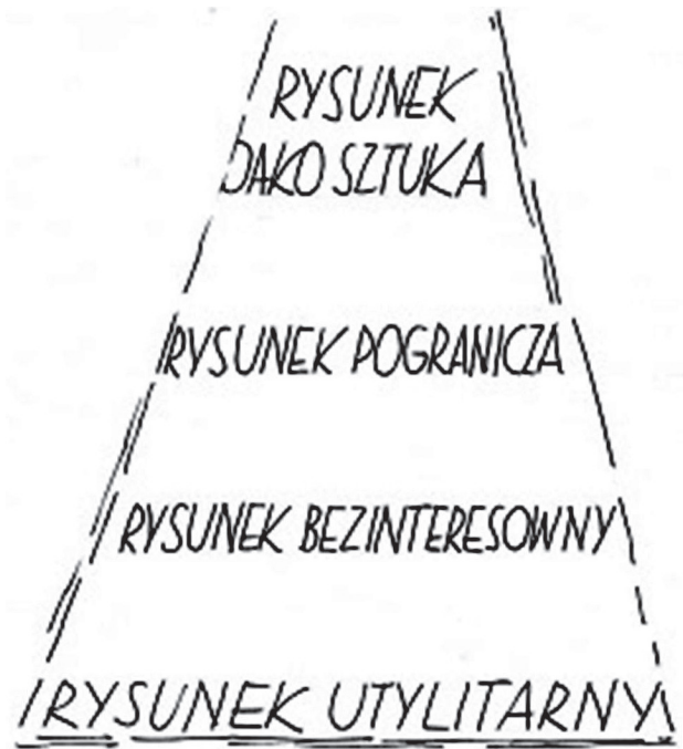
Il. 1. Piramida rysunku

Imponujące są szkicowniki artystów zawierające setki szkiców, ukazujące proces kształtowania się myśli i koncepcji; i bez względu na to, czy są to rysunki Albrechta Dürera, Leonarda, Rembrandta, Edgara Degasa czy Henriego Matisse’a, Jeana Fautriera, Alberto Giacomettiego, możemy na podstawie tych zapisów odczytać myśli i intencje autora, zrozumieć sposób widzenia. Rysunek ujawnia postrzeganie świata, rzeczy, zdarzeń, które zdecydowanie